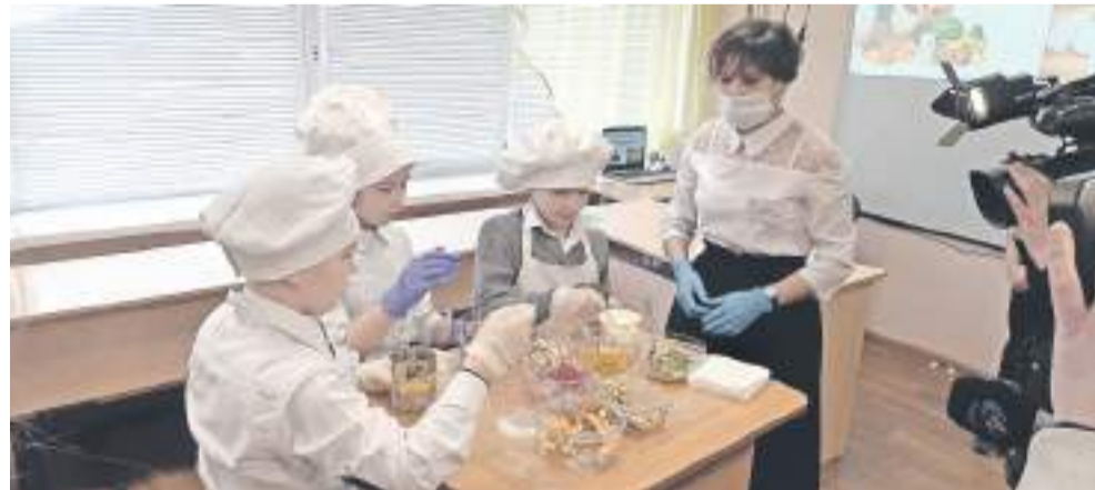
На внеурочке, посвящённой правильному питанию, ученики школы с УИОП готовят вкусные и полезные блюда