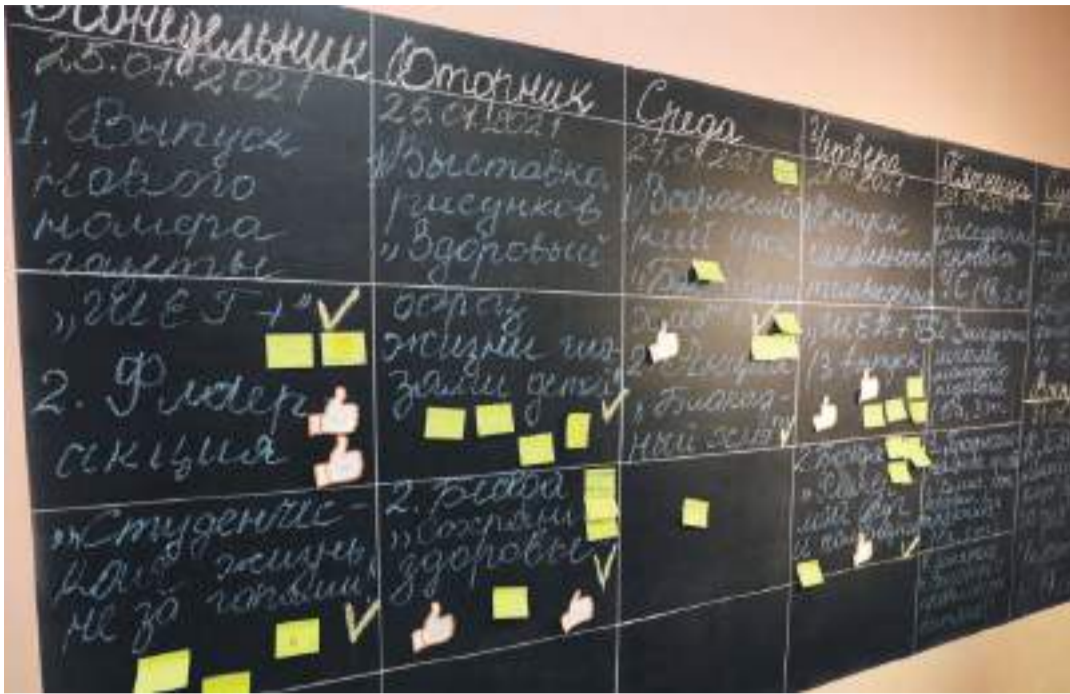
«Говорящая» стена в школе с УИОП