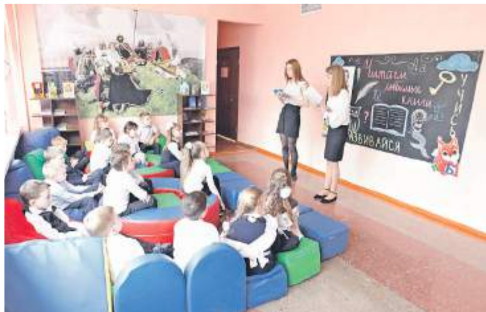
В рамках проекта «Дети — детям» старшеклассники читают книги ученикам начальной школы (Ровеньская школа с углублённым изучением отдельных предметов)