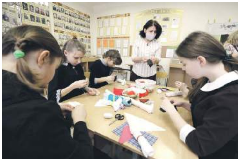
В рамках программы «Народная и авторская кукла» ученицы Новоалександровской школы учатся шить куклу-столбушку