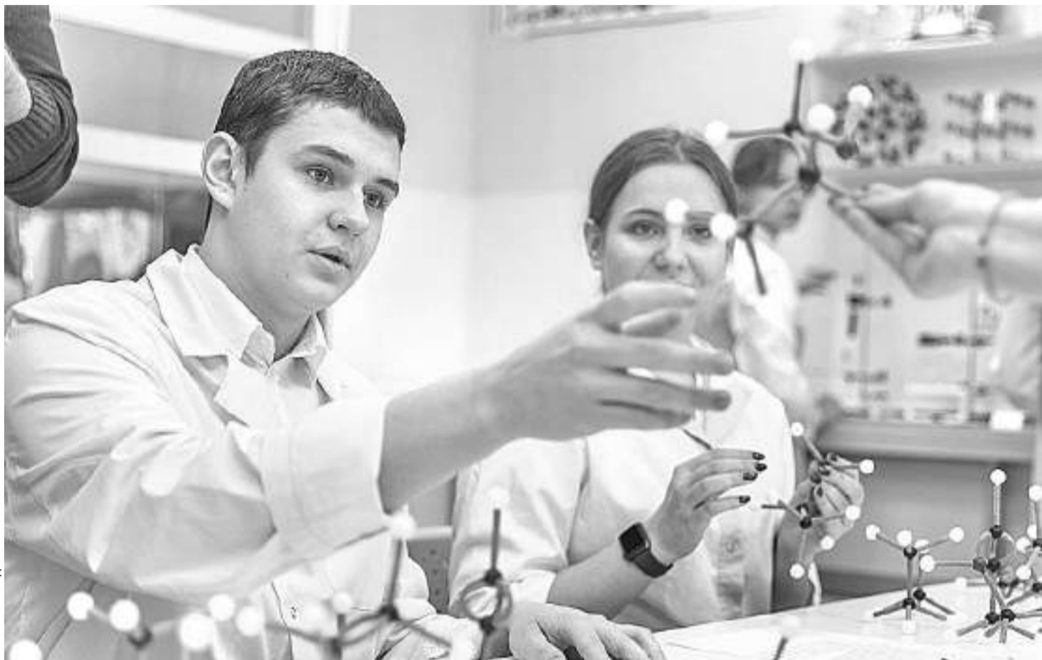
В химической лаборатории Шуховского лицея

В СОЦИАЛЬНЫХ СЕТЯХ ПОЯВЛЯЛОСЬ МНОГО СООБЩЕНИЙ О ТОМ, ЧТО СИТУАЦИЯ С КОРОНАВИРУСОМ — ЭТО ОСНОВАНИЕ ДЛЯ ПЕРЕВОДА ВСЕЙ СИСТЕМЫ ОБРАЗОВАНИЯ В ДИСТАНЦИОННЫЙ ФОРМАТ НА ПОСТОЯННОЙ ОСНОВЕ. УБЕЖДАТЬ НАРОД, ЧТО ТАКИЕ ЗАЯВЛЕНИЯ ОДНОЗНАЧНО БЕСПОЧВЕННЫ, НАМ СУЩЕСТВЕННО ПОМОГАЛ ОПЫТ ШКОЛ РАН, КОТОРЫЕ ПРОДЕМОНСТРИРОВАЛИ, ЧТО ОБРАЗОВАНИЕ — НЕ ТОЛЬКО ПРИОБРЕТЕНИЕ СУММЫ ЗНАНИЙ, НО ЭТО, ПРЕЖДЕ ВСЕГО, СОЦИАЛИЗАЦИЯ РЕБЯТ, ПЕРЕДАЧА ОПЫТА ПОКОЛЕНИЙ, ДУХОВНО-НРАВСТВЕННЫХ ЦЕННОСТЕЙ, ЧТО ЯВЛЯЕТСЯ НЕВОЗМОЖНЫМ БЕЗ ЛИЧНОСТИ УЧИТЕЛЯ, БЕЗ НЕПОСРЕДСТВЕННОГО ВЗАИМОДЕЙСТВИЯ С УЧЕНИКОМ, БЕЗ УЧАСТИЯ РЕБЁНКА В КОЛ-