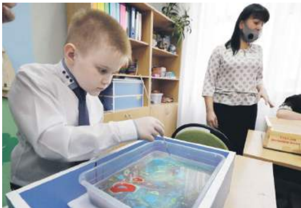
Занятие по акваанимации в Новоалександровской школе

Дальше директор ведёт нас в «деревню Йогуртово». Она расположилась в обычном классе, только вместо учебников и ручек на столе — йогурты, фрукты и другие начинки и добавки.