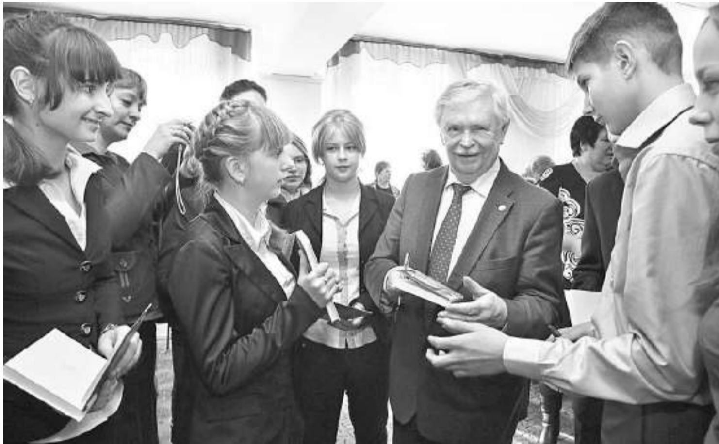
Альберт Лиханов в Грайворонской районной библиотеке

ПОЧЕМУ ЧИТАТЕЛЕЙ ПРОИЗВЕДЕНИЙ АЛЬБЕРТА ЛИХАНОВА МОЖНО НАЗВАТЬ НРАВСТВЕННЫМИ ЛЮДЬМИ