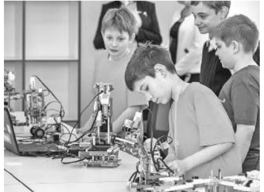
Студия робототехники Шуховского лицея