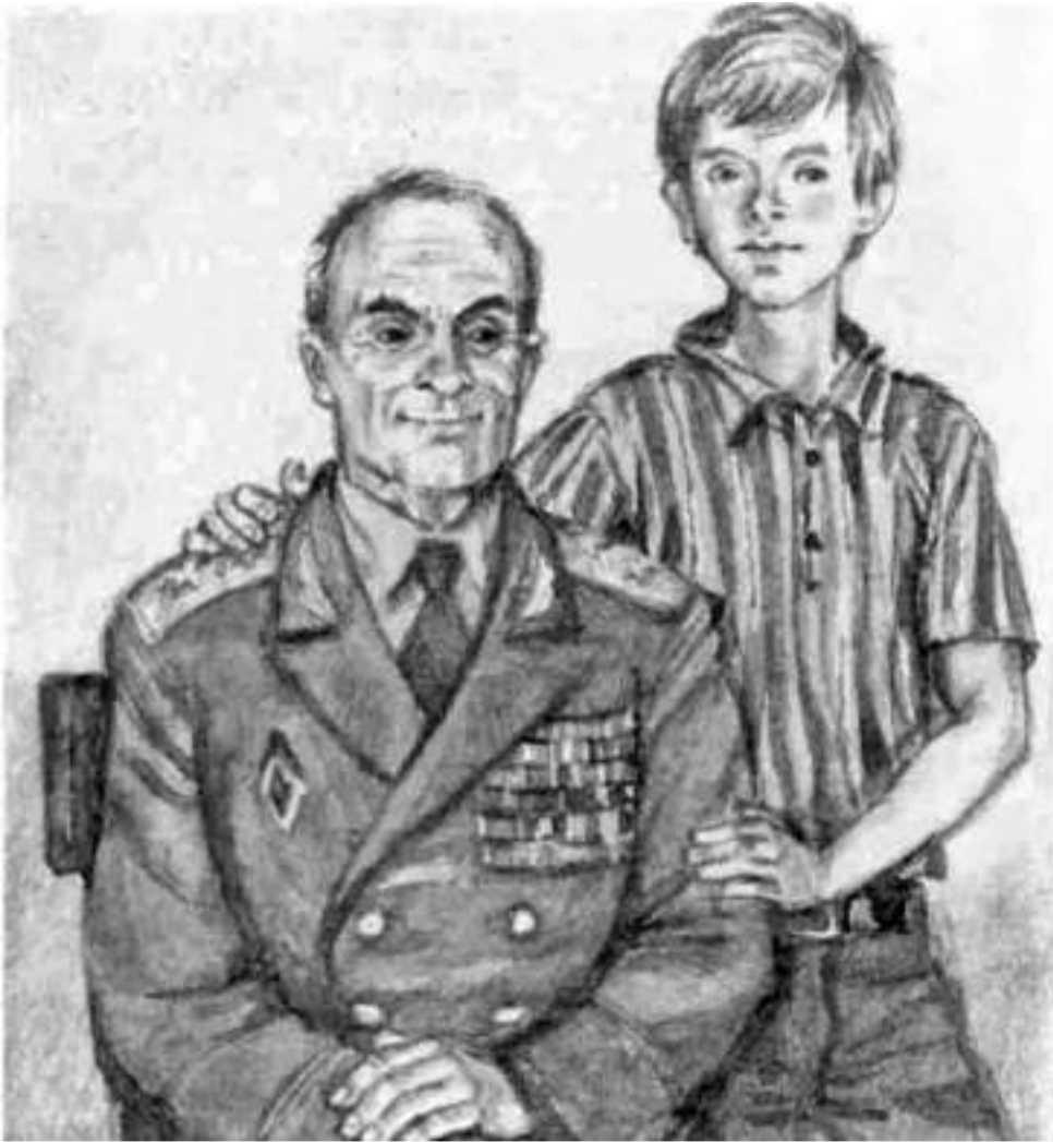
Иллюстрация к повести «Мой генерал» художника Юрия Иванова

ЧИТАТЬ СТАТЬЮ «ИСКАТЬ ДОБРО ВОКРУГ СЕБЯ» О КНИГЕ «НЕЗАБЫТЫЕ ИГРУШКИ»