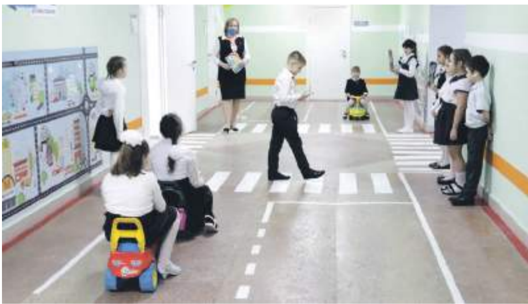
Занятия в образовательной зоне «Правила движения достойны уважения!» в школе № 2

ского творчества. Здесь занимаются и младшие школьники, для которых конструирование роботов — уже привычное дело. Как и для учеников школы с УИОП: в зависимости от возраста детей здесь действует два объединения дополнительного образования — «Робототехника» и «Введение в робототехнику».