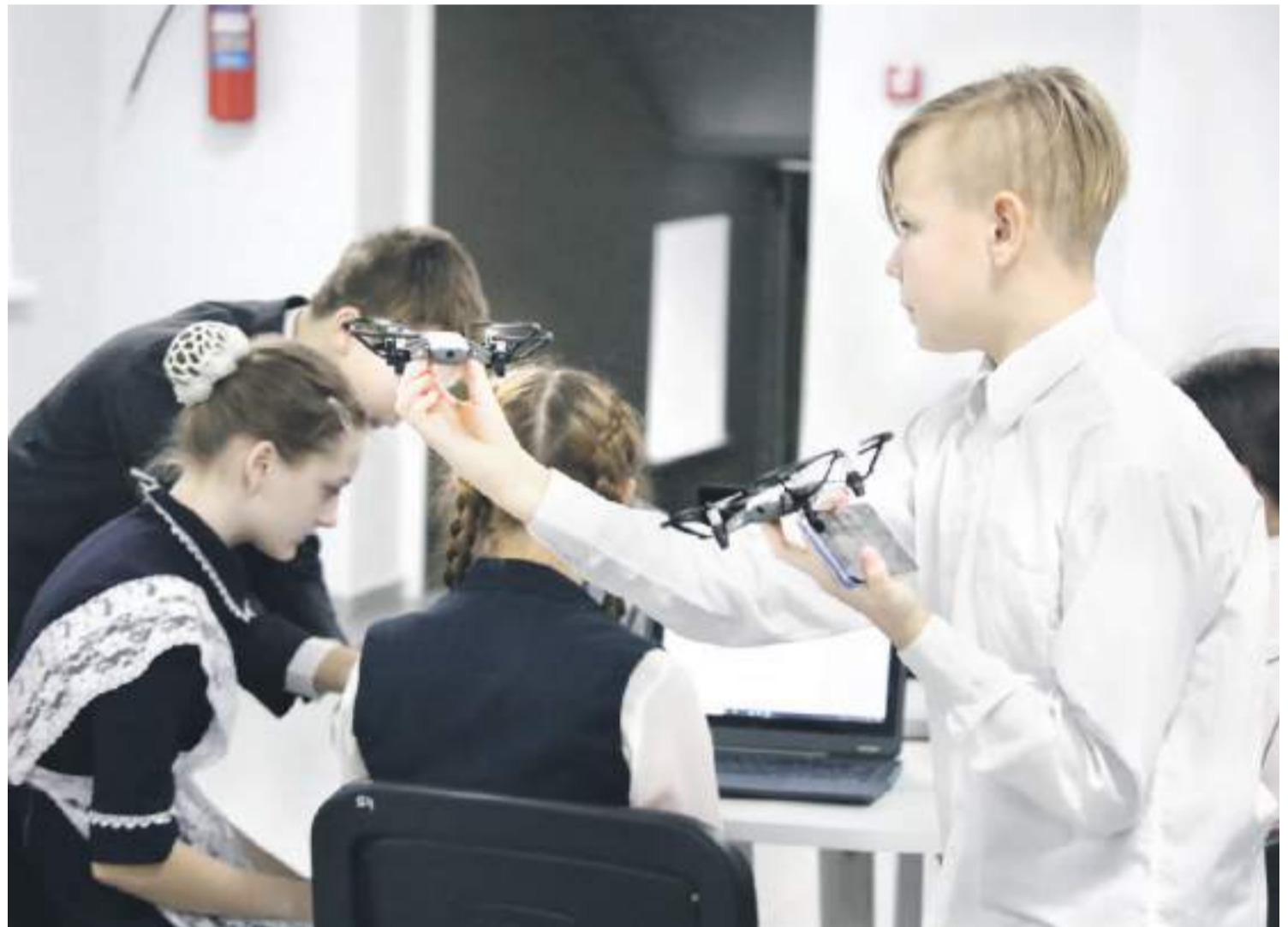
Квадрокоптерами сейчас даже в сельской школе никого не удивишь. С ними легко справляются в «Точке роста» Ровеньской школы № 2

На занятии внеурочной деятельности у младших школьников «Начинаем изучать английский язык» нам показали, как можно использовать флеш-карты (не компьютерные флешки, а карточки