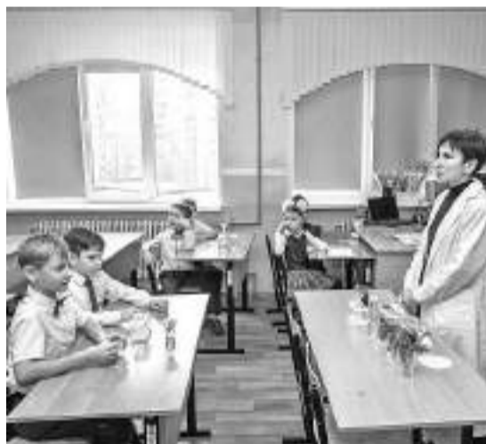
Шуховцы изучают кислотность почв