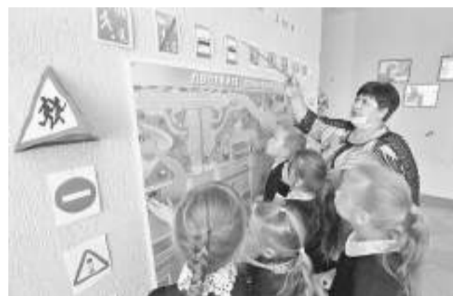
В Клименковской школе Вейделевского района

действию этих мероприятий на конкретного ребёнка сиюминутно, потому что результат, как правило, отдалён во времени, к тому же отсутствуют измерители воспитанности и сформированности навыка поведения на дороге. Но ни одна школа не стоит в стороне от этой работы.