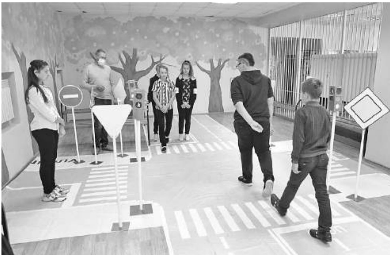
В Курасовской школе Ивнянского района

В наших школах во второй половине дня организованы пятиминутки безопасности перед уходом школьников домой, просмотр видеороликов, выступления агитбригад, проведение интеллектуально-познавательных и сюжетно-ролевых игр, целевых прогулок и экскурсий. Белгородская область принимает участие во всех всероссийских мероприятиях, которые рекомендованы Министерством просвещения Российской Федерации. Мы не можем делать выводы о воспитательном воз-