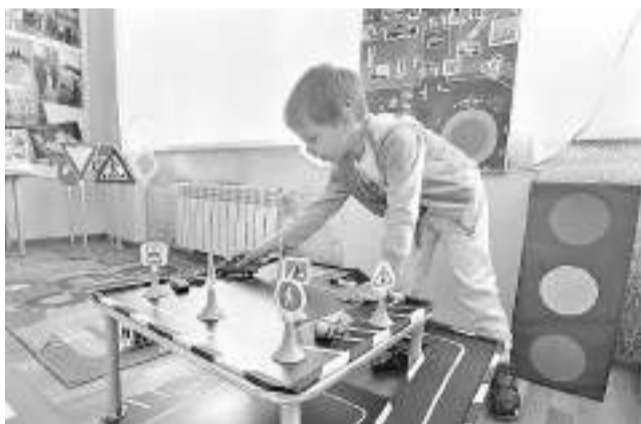
В детском саду «Сказка» пос. Ивня